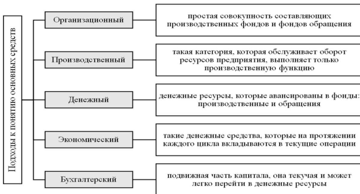
Рис. 1. Подходы к понятию оборотных средств

Каждый из подходов к определению понятия «оборотных средств» имеет свое значение и особенность. Их различие можно объяснить разной функциональной значимостью оборотных средств для экономической деятельности организаций. Поэтому и рассматривать данное понятие стоит с позиции разных подходов, ориентируясь на функциональные задачи и потребности. Учетная деятельность в отношении оборотных средств – важная задача, решение которой позволяет анализировать эффективность использования данных активов в основной деятельности предприятия.